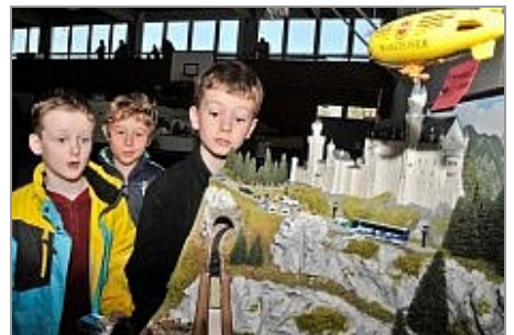
Stauende Zuschauer ...