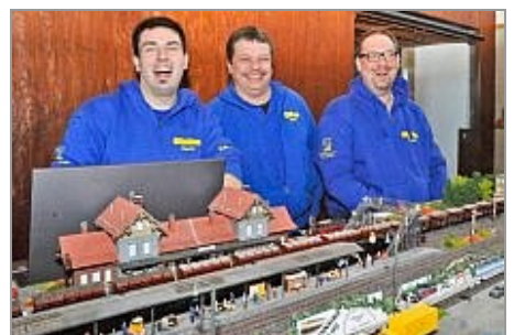
Das Team der Alsfelder Eisenbahnfreunde ...