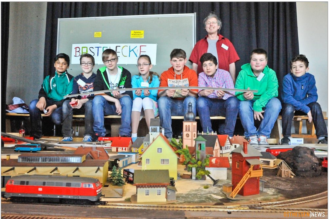
Die Modellbahn AG des Steingymnasiums unter ...