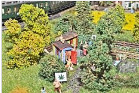
Hanfplantage am Bahndamm ... ..